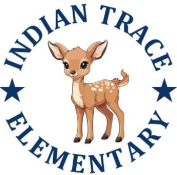
Indian Trace (754)323-6300