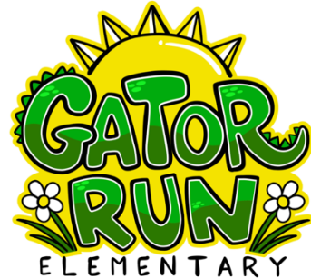
Gator Run (754)323-5850