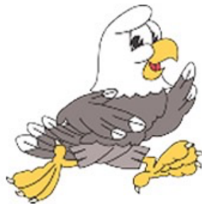
Eagle Point (754)323-5500