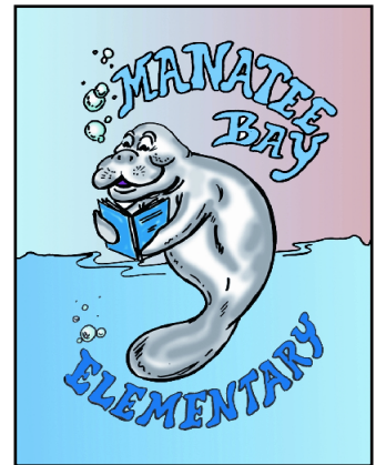
Manatee Bay (754)323-6450

All adults must bring an ID to enter campus. Your child must be 5 years old by September 1, 2025 to register for kindergarten for the 2025 -2026 school year.