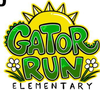
Gator Run (754)323-5850